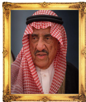
رئيس مجلس الإدارة الشيخ / حمد بن عبدالعزيز الجميح