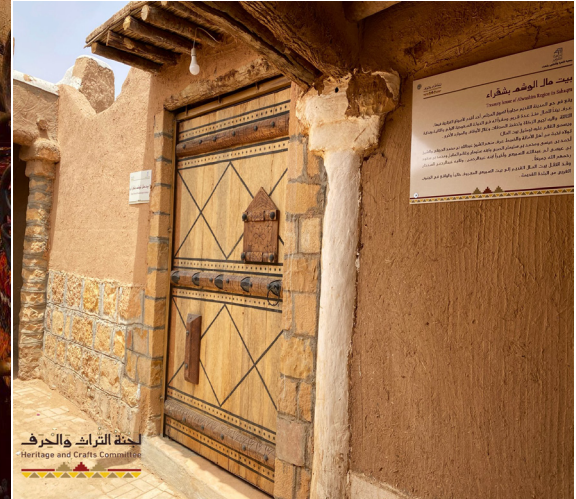
لجنة التراث والحرف Heritage and Crafts Committee

تشغيل المتحف والبيوت التراثية يفتح المتحف أبوابه للزوار من الساعة الثامنة صباحاً حتى أذان الظهر ومن بعد صلاة العصر حتى العاشرة مساءً تفتح البيوت التراثية للزوار من الساعة الرابعة عصراً حتى الثامنة مساءً