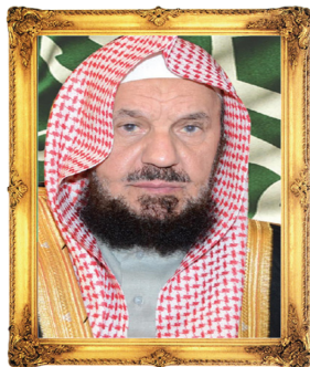
نائب رئيس مجلس الإدارة معالي الشيخ / عبدالله بن سليمان المنيع